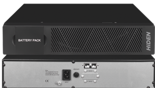
Внешний вид батарейного кабинета